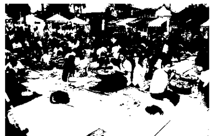
กินพานเลงก่อนเริ่มการแสดง

หนังสือท้ออีสาน หรือ “หนังสือท้อ” จากคณะเพชรอีสาน เยาวชนจาก อ.โพธิ์ศรีสุวรรณ