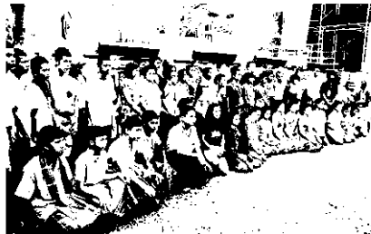
นักแสดงเยาวชนจากกลุ่มต่างๆ ในอีสาน

มหาวิทยาลัยมหิดล ร่วมกันจัดขึ้นตามโครงการขับเคลื่อนสื่อพื้นบ้าน เพื่อสุขภาวะเยาวชน ครั้งนี้เป็นการรวบรวมเอาสื่อพื้นบ้านอีสานมากถึง 11 กลุ่ม จาก 8 จังหวัด ประกอบด้วย