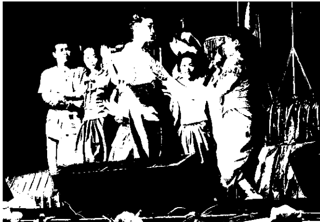
เยาวชนสื่อพื้นบ้านเพลงโคราช

สื่อพื้นบ้านเป็นสื่อที่มีชีวิต เป็นการเชื่อมต่อภูมิปัญญาของคนหลายรุ่น หลากวัย และหลายพื้นที่เข้าไว้ด้วยกันอย่างลงตัว ที่สำคัญคือสร้างความใกล้ชิด และการมีส่วนร่วมของคนในชุมชนนั้นๆ ทั้งยังสืบสานภูมิปัญญาท้องถิ่นที่นับวันจะเลือนหาย ผ่านในรูปแบบ