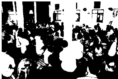
บายศรีสู่ขวัญนักแสดง

ตั้งในงานมหกรรม "ตุ่มโฮม โรมแนม ซูปแต้มศิลป์ ดินอีสาน" ที่สำนักงานกองทุนสนับสนุนการสร้างเสริมสุขภาพ (สสส.) ร่วมกับสถาบันวิจัยภาษาและวัฒนธรรมเอเชีย