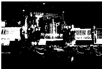
การแสดงพื้นเมืองใส่ทั้งบั้ง แห่งบ้านโพนจาน จ.นครพนม