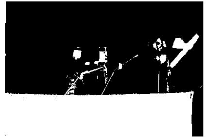
หนังสือท้อ ของเยาวชนบ้านดงบัง

เปิดเริ่มการแสดง โดยเยาวชนสร้างสรรค์ สื่อพื้นบ้าน เพลงโคราช จนครราชสีมา ที่สมาคมเพลงโคราช จัดกิจกรรมให้เยาวชนรุ่นใหม่ 6 โรงเรียน มาเรียนตอกกลอง ขับร้อง เพลงโคราช ที่ทั้งท่วงทำนองถอดมาจากต้นแบบอย่างไม่คิดเพี้ยน แต่ประยุกต์เนื้อเพลงให้เข้ากับยุคสมัย เกี่ยวกับการฉรมรงค์ลด ละ เลิกบุหรี สุรา