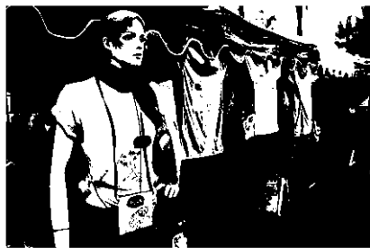
ตุ่มเสื้อผ้า และสิ่งของทำมือ

โดยเฉพาะเยาวชน ที่จะได้เรียนรู้สื่อพื้นบ้านในชุมชนของตัวเอง ส่งผลให้เกิดความสัมพันธ์ที่ดีในชุมชน ช่องว่างระหว่างผู้สูงอายุและเด็กรุ่นใหม่แคบลง รวมถึงคนในชุมชนก็ได้พบกัน และพูดคุยแลกเปลี่ยนความคิดเห็นระหว่างกัน