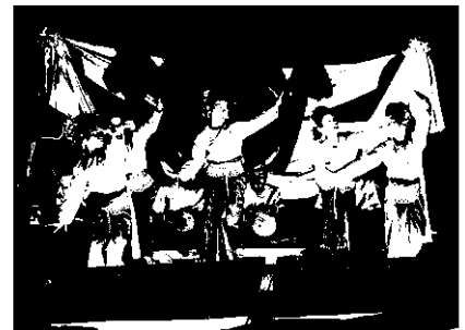
กันตริมวัยใส เยาวชนจากสุรินทร์

เป็นภาษาถิ่นอีสาน หมายถึง การมาร่วมกัน ส่วนคำว่า "โรมแนม" เป็นภาษาถิ่นโคราช หมายถึง การมาดูของดี และคำว่า "ซูปแต้ม" ก็คือภาพวาด นั่นเอง